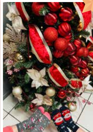
Contraloría de Servicios