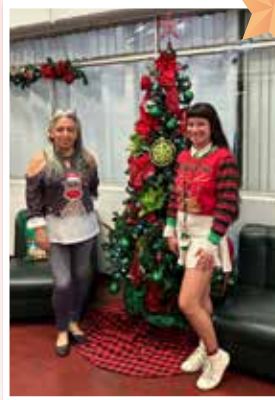
Fracción PLP y PLN