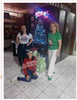
Secretaría del Concejo