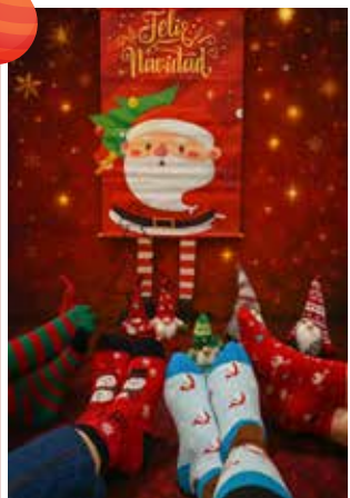
Contabilidad y Costos